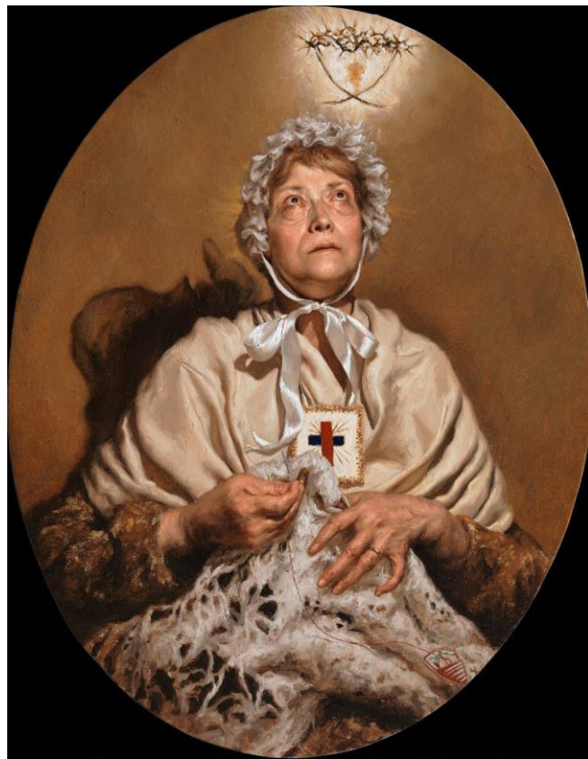
Bienheureuse Anna Maria Taigi