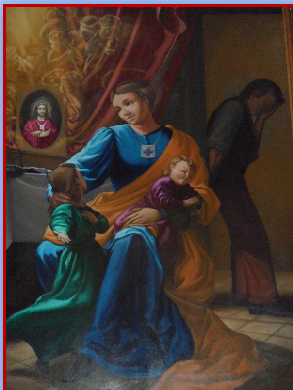
(Elisabeth Canori Mora. Huile sur toile dans l'église des Trinitaires espagnols de Naples - Italie.)