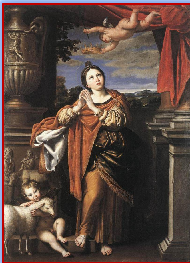
S. Agnese (Domenichino, Olio su tela, 1620 circa)